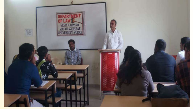
(અહેવાલ: ડો. ગૌરાંગ રામી)