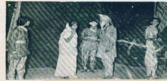
સુરત ખાતેના નાટ્ય તાલીમ શિબિરમાં રજૂ થયેલ નાટક "સીતા" નું એક દ્રશ્ય