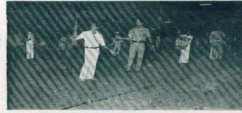
ચાકુળાખરૂની મેળા દરમિયાન ટ્રાફિક નિયંત્રણ કરના આર. એસ. પી. ના સ્વયંસેવકો