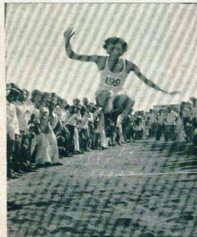
વલસાડ ખાતેના યુનિવર્સિટીના સાતમા ખેલકૂદ મહોત્સવમાં "લાંબા કૂદકાનું" એક દ્રશ્ય