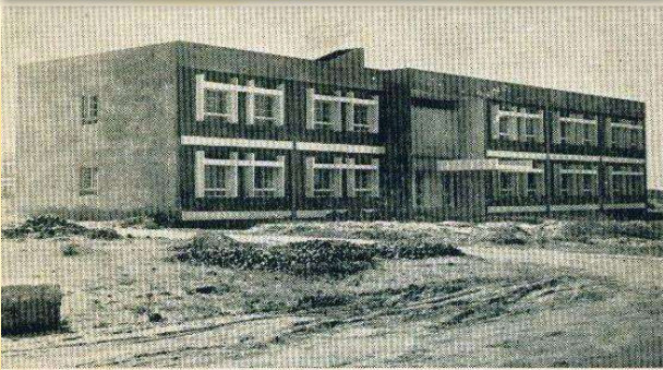
માનવવિદ્યા અને સમાજવિદ્યાના અનુસ્નાતક વિભાગનું તૈયાર થયેલું મકાન