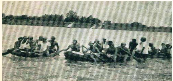
સુરત ખાતેના તરણ - નૌકાતાલીમ શિબિરમાં તાલીમ લેતા શિબિરાર્થીઓ