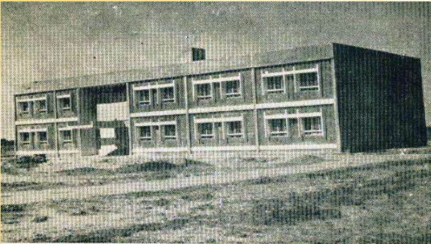
વ્યાપાર અને ઉદ્યોગ સંચાલન વિભાગનું તૈયાર થયેલું મકાન