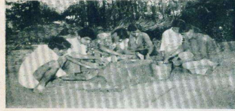
કન્યાશ્રમ, મઢી મુકામે યોજાયેલ શ્રામ આશિષ અને સફાઈ શિબિરમાં નિર્ધુમ સુલો ખનાવતા એમ. ડી. બી. આઈસ કોલેજના વિદ્યાર્થીઓ